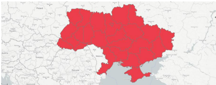
Figura 1. Situación de la enfermedad en Ucrania

La rabia está extendida por todo el territorio ucraniano.